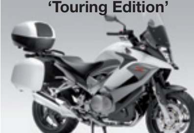
Crossrunner ABS MY11&12 'Touring Edition'

€ 13.840 € 11.990 Votre avantage : € 1.850 topbox, bulle haute, poignées chauffantes, béquille centrale, valises latérales & déflecteurs inclus