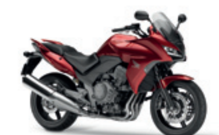
CBF1000F ABS MY11&12

€ 11.090 € 9.990 Votre avantage : € 1.100