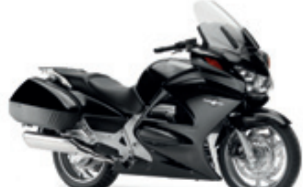
ST1300 Pan European ABS

€ 18.535 € 15.990 Votre avantage : € 2.545 topbox 45l. inclus