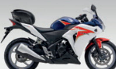
CBR250R 'Comfort Edition' MY11&12

€ 4.245 € 3.990 Votre avantage : € 255 tail pack, stickers de roues & set de tank pads inclus