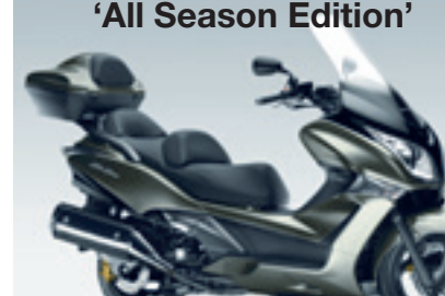
SW-T600 ABS 'All Season Edition'

€ 9.905 € 8.990 Votre avantage : € 915 tablier, topbox 40l. & poignées chauffantes inclus