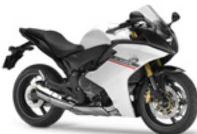
CBR600F ABS MY11&12

€ 10.740 € 9.290 Votre avantage : € 1.450 sissy bar, bulle haute & valises latérales en cuir inclus