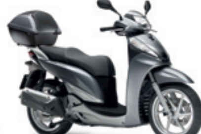
SH 300 ABS MY11&12

€ 5.690 € 4.990 Votre avantage : € 700 topbox 35l. inclus