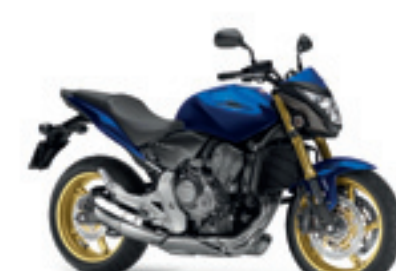
CB600F Hornet ABS MY11&12

€ 8.590 € 6.990 Votre avantage : € 1.600