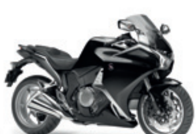
VFR1200F ABS MY10&11

€ 14.990 € 12.990 Votre avantage : € 2.000