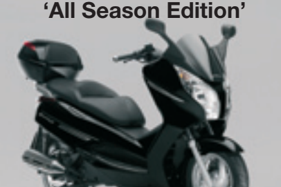
S-Wing 125 ABS 'All Season Edition'

€ 5.135 € 3.990 Votre avantage : € 1.145 tablier & topbox 35l. inclus