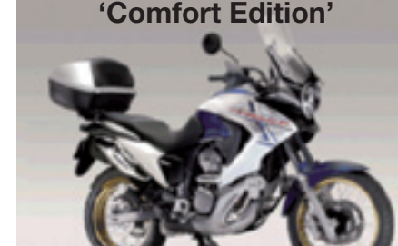
XL700V Transalp ABS 'Comfort Edition'

€ 9.540 € 8.290 Votre avantage : € 1.250 topbox 45l., bulle haute & béquille centrale inclus