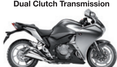
VRF1200F ABS MY10&11 Dual Clutch Transmission

€ 16.290 € 14.190 Votre avantage : € 2.100