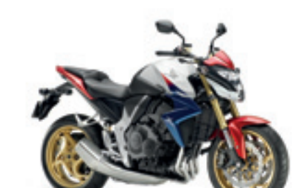
CB1000R ABS MY11&12

€ 11.790 € 10.490 Votre avantage : € 1.300 + € 100 pour Tricolor