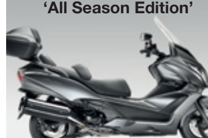
SW-T400 ABS 'All Season Edition'

€ 8.865 € 7.690 Votre avantage : € 1.175 tablier, topbox 40l. & poignées chauffantes inclus