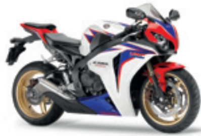
CBR1000RR ABS MY10

€ 16.990 € 13.690 Votre avantage : € 3.300