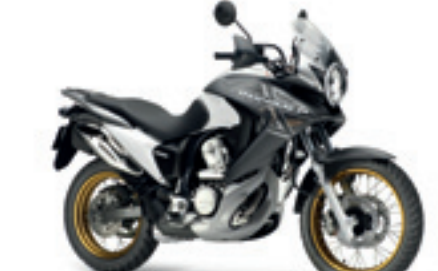
XL700V Transalp ABS

€ 9.040 € 7.990 Votre avantage : € 1.050 topbox 45l. inclus