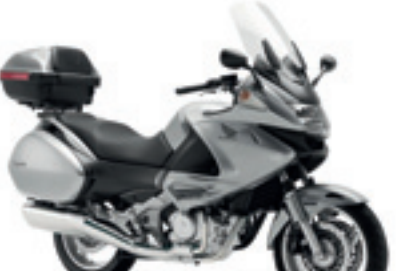
NT700V Deauville ABS

€ 10.865 € 9.990 Votre avantage : € 875 topbox 45l. inclus