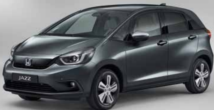
SHINING GRAY METALLIC