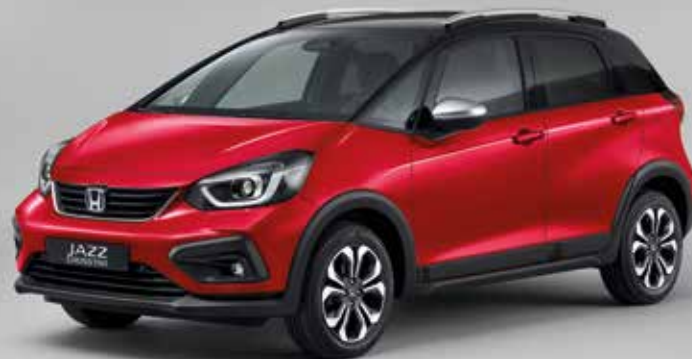
PREMIUM CRYSTAL RED METALLIC / TWO-TONE