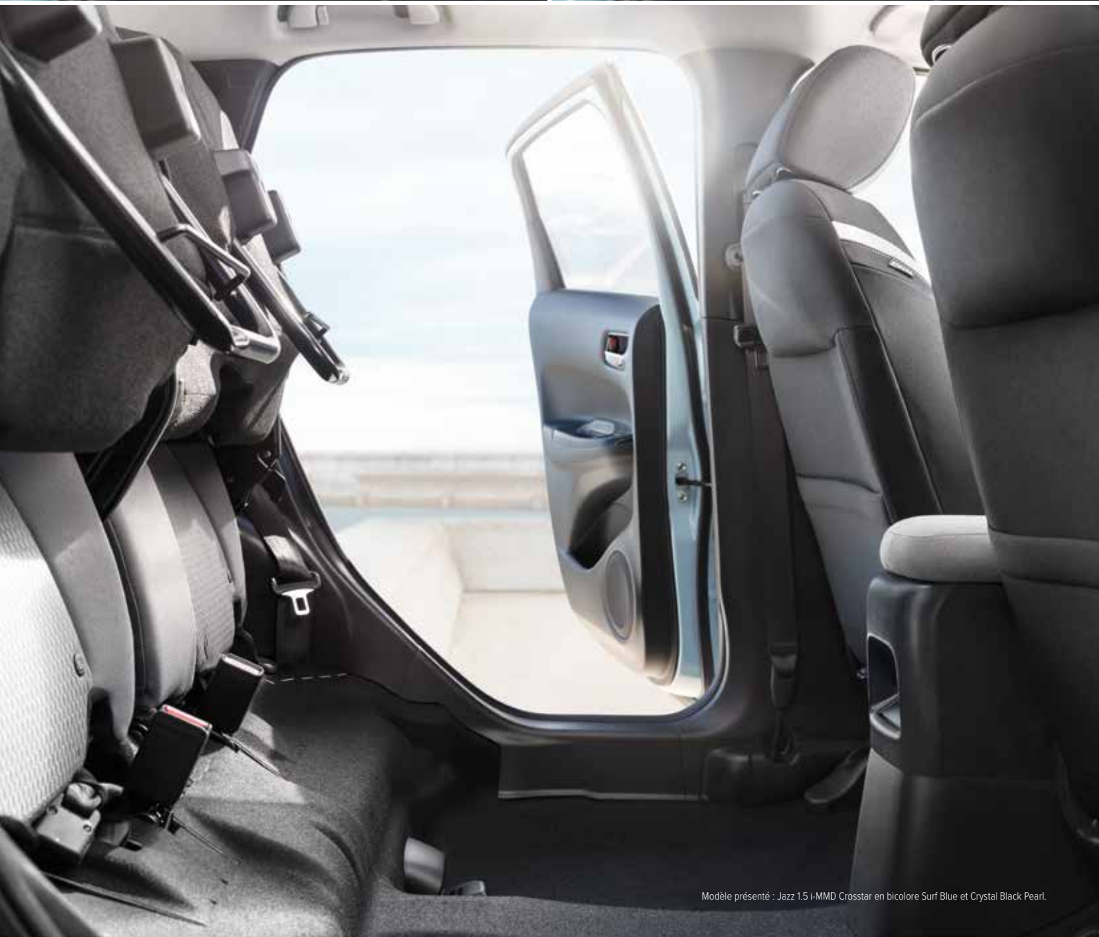
Modèle présenté : Jazz 1.5 i-MMD Crosstar en bicolore Surf Blue et Crystal Black Pearl.