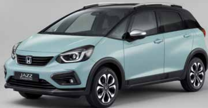
SURF BLUE / TWO-TONE