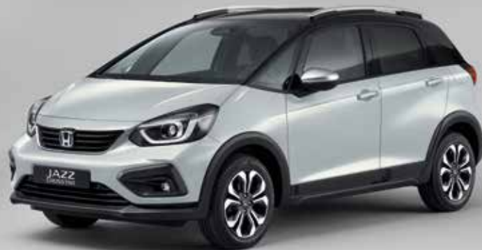
PREMIUM SUNLIGHT SILVER PEARL / TWO-TONE