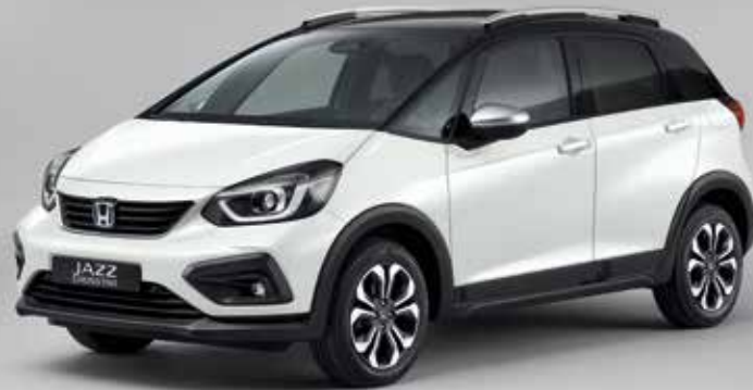
PLATINUM WHITE PEARL / TWO-TONE