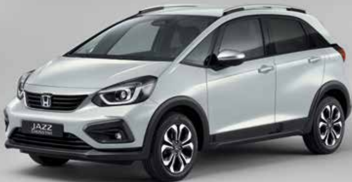
PREMIUM SUNLIGHT SILVER PEARL